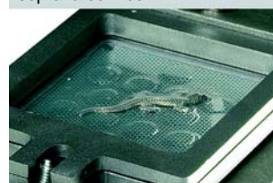
3. Dopo aver riscaldato la plastica applicare il vuoto ed abbassare la piattaforma