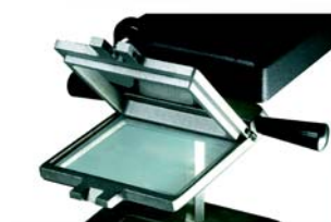
1. Mettete il foglio di plastica sopra la cornice