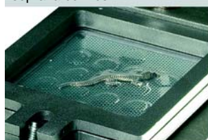
3. Dopo aver riscaldato la plastica applicare il vuoto ed abbassare la piattaforma