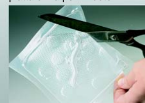
4. Eliminare la plastica dal modello. E' pronto per essere montato sull'alberino.