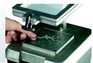
2. Mettete gli originali sulla piattaforma per il vuoto