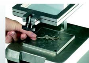
2. Mettete gli originali sulla piattaforma per il vuoto