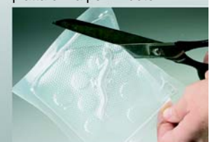
4. Eliminare la plastica dal modello. E' pronto per essere montato sull'alberino.